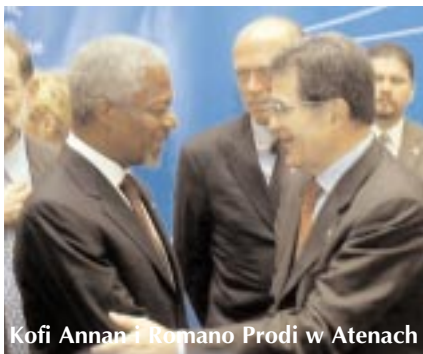
Kofi Annan i Romano Prodi w Atenach

Europejskiej „z wysoko podniesionym czołem”. „Na długo przed upadkiem muru berlińskiego zdemonstrowali swoje pragnienie, żeby żyć w wolności i demokracji wraz z innymi Europejczykami” - podkreślił szef organu wykonawczego Romano Prodi na zakończenie uroczystości. „Musimy podziękować im za cichą rewolucję, której dokonali w ostatnich dwunastu latach, za sposób, w jaki zreformowali swoje systemy polityczne, swoje gospodarki, administracje i wymiary sprawiedliwości” - mówił.